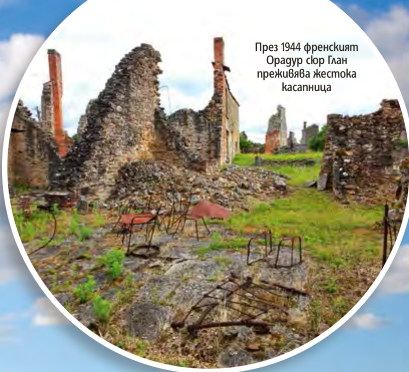
През 1944 френският Орадур сюр Глан преживява жестока касапница

Къде ходят на гости, без да са чули „заповядай“? В света съществуват няколко града, заради които, АКО ХАРЕСВАШ САМОТАТА , можеш спокойно да напуснеш родното си място