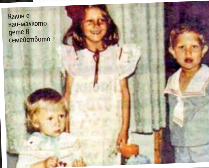
Калин е най-малкото дете в семейството