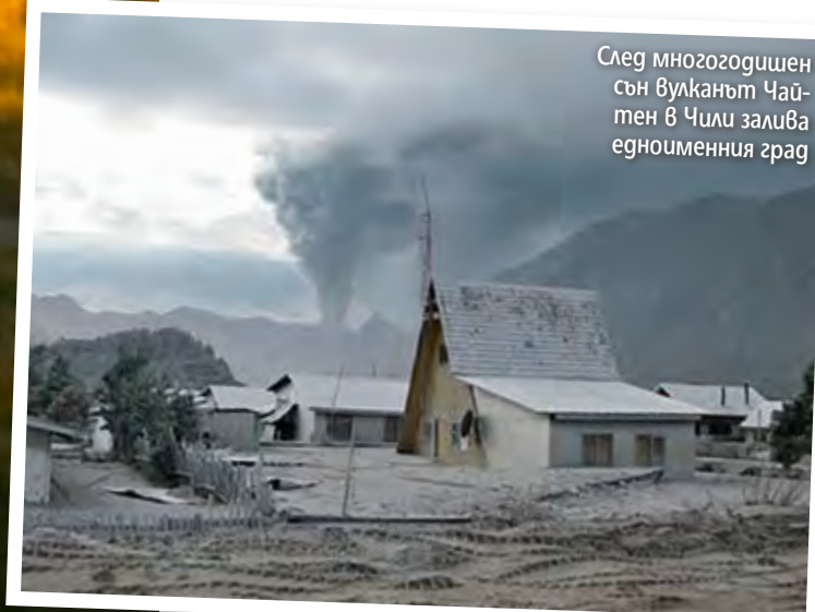
След многогодишен сън вулканът Чайтен в Чили залива едноименния град

Заселването на острова, до откат натъпкан с въглища, започва през 1887 г. Поколението расте, миньорите се размножават и към 1959 град Хашима става най-гъстонаселеното място на Земята: при дължина на бреговата линия 1 км тук живеят 5259 души. В началото на 70-те населението започва обаче да се уморява ▶