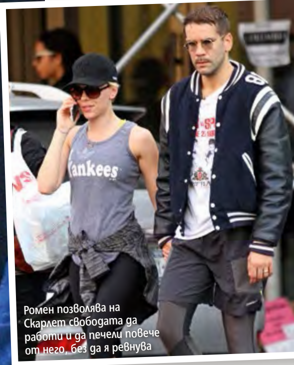
Ромен позволява на Скарлет свободата да работи и да печели повече от него, без да я ревнува

СКАРЛЕТ ЙОХАНСОН вече не желае да бъде зависима от когото и да било