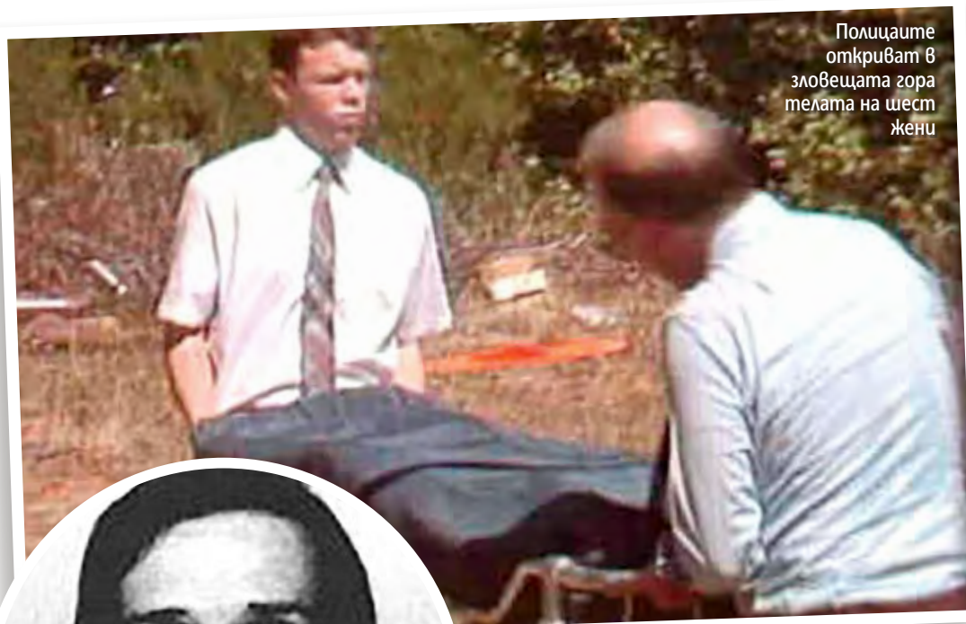
Полицайте откриват в зловещата гора телата на шест жени