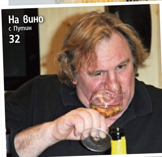
На вино с Путин 32