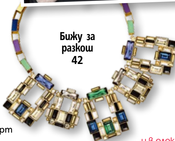
Бижу за разкош 42

Посетете страницата ни във facebook списание „Story“