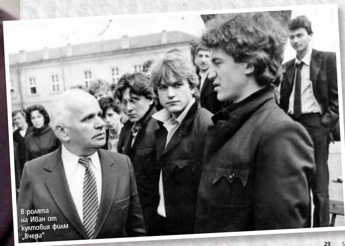
В ролята на Иван от култовия филм „Вчера“

„Много обичат ролята на Иван. Винаги, когато се сетя, установявам колко много си приличат поят характер и този на героя“