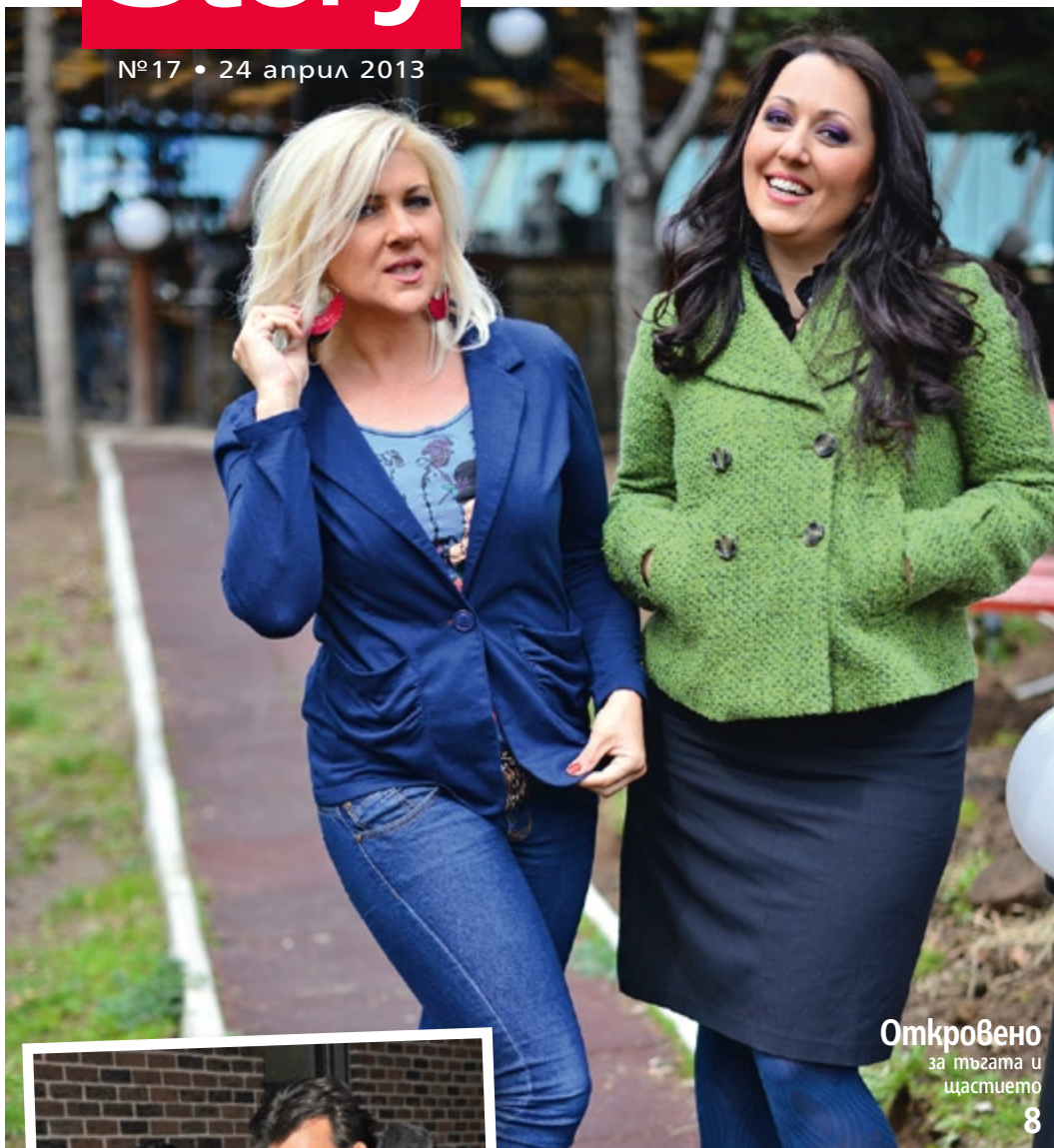
Откровено за тъгата и щастието 8