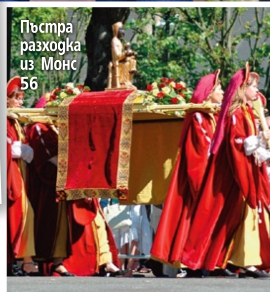
Пъстра разходка из Монс 56

Посетете страницата ни във facebook списание „Story“