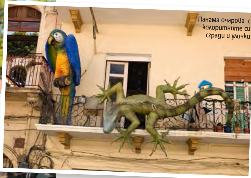
Панама очарова с колоритните си сгради и улички

години похарчила два пъти повече от предвидените средства, а построеното се оказало по-малко от една трета от предвиденото. Изправена пред грандиозен скандал компанията започнала масово да подкупва журналисти и политици, за да не излезе истината наяве. Но както винаги се случва, тя все пак лъснала. Така в началото на XX век вместо канал се родил известния Панамски скандал. Ос-