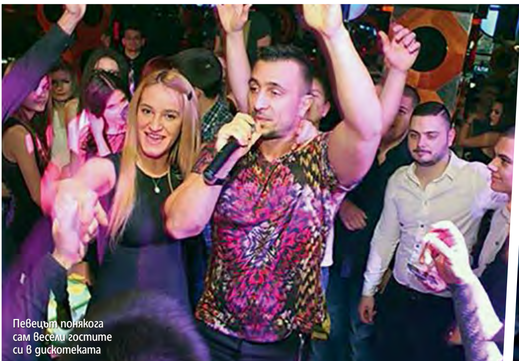
Певицът понякога сам весели гостите си в дискотеката