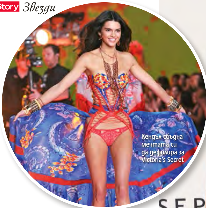
Кендъл сбъдна мечтата си да дефилира за Victoria's Secret

Д а си част от най-популярното риалити семейство, се оказа нож с две остриета. Поне до този извод стигна една от малките сестри в клана Кардашиян - Дженър, която в момента жъне успехи по модните подиуми и е сред любимките на редица световни дизайнери. Въпреки че работи неуморно и всяка седмица лети до различни точки на света, за да изпълнява многобройните си ангажименти, все още се сблъсква с много критики, че именно известните ѝ роднини са в основата тя да постигне този триумф.