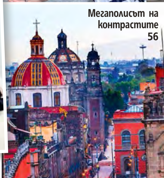
Мегаполисът на контрастите 56