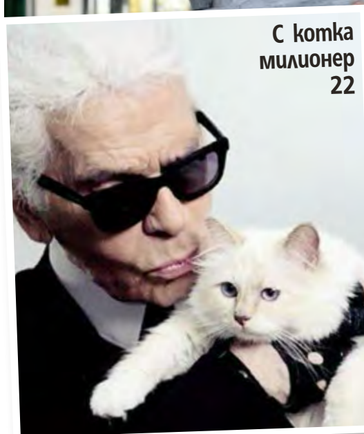
С котка милионер 22