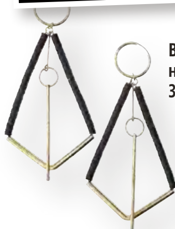
В света на Изтока 38

Посетете страницата ни във facebook списание „Story“