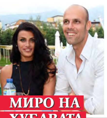
МИРО НА ХУБАВАТА