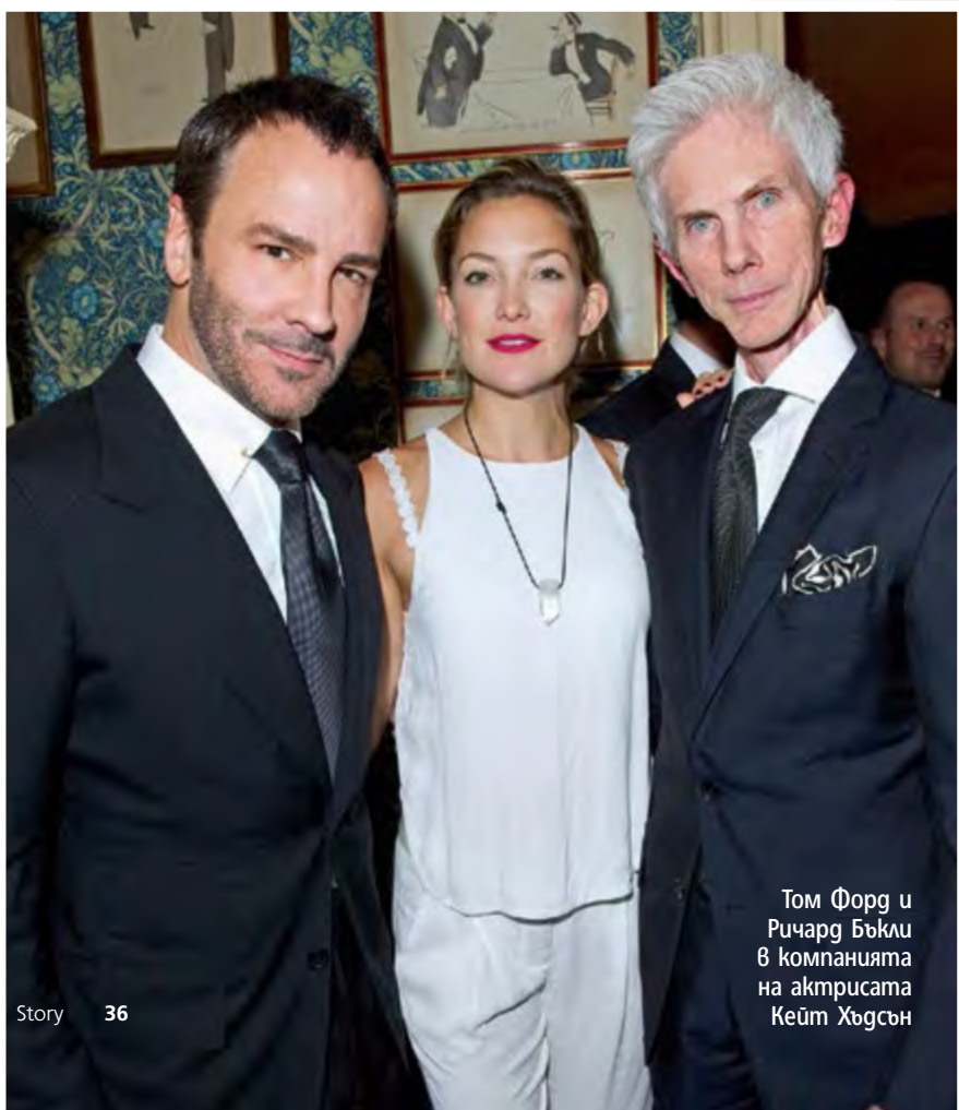
Том Форд и Ричард Бъкли в компанията на актрисата Кейт Хъдсън