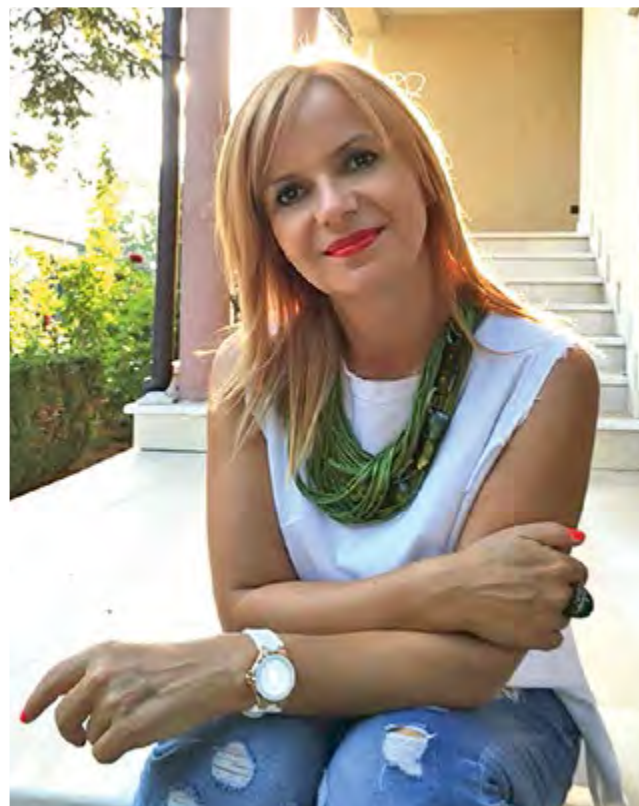
АВТОР: ДОРА ПРАНГАДЖИЙСКА, DORAPRANGADZHIYSKA.COM

Тя е един от трите активни модела на поведение, насочен към задоволяване на потребностите ни, който се формира от първата до третата година в т.нар. Фаза на Аза или Фаза на противопоставянето. Терминът „здрава агресия“ носи смисъла на отстояване на себе си, поставяне на границите, борбеност, инициативност, умение да вземаме решения и да понасяме отговорности, пробивност, всичко, което е противоположно на пасивност и неинициативност. След излизането от психичната слятост с мама, характерен за първата годинка, детето започва да развива своята автономност. В този период то прохода, съгласява се или отказва, затваря се или се отваря и разбира, че мама и то са две отделни неща. Ако иска може да е до нея, но може и да се отдалечи, може да направи това, което мама очаква, но може да направи и нещо друго. Казването на „Не“ е начин да утвърди своята индивидуалност както пред себе си, така и пред света. Когато мама е осъзната за този естествен поведенчески модел и в здрави граници толерира казането на „Не“, детето израства с усещането, че е обичано, въпреки, че винаги прави това, което се очаква от него. Когато обаче мама е по-авторитарна, кастрираща или саможертвена, детето започва да се страхува, че ако се противопоставя, то ще изгуби любовта ѝ. Ако обърне агресията към мама, тя може да оттегли любовта си и така започва да се държи прилично, да не се противопоставя, да е дисципли-