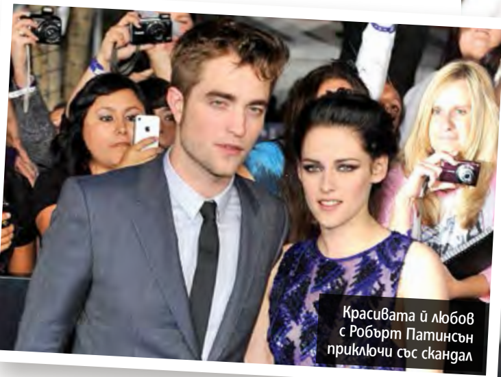
Красивата ѝ любов с Робърт Патинсън приключи със скандал

Актрисата КРИСТЕН СТЮАРТ трудно преодоля раздялата с голямата си любов Робърт Патинсън, на когото изневери с режисьора Рупърт Сандърс