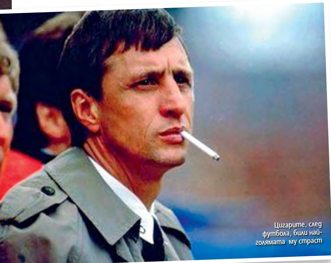
Цигарите, след футбола, били най-голямата му страст

Кройф пленява Дани Костер. Особено тънките му устни, почти като на момиче. Освен красива, Дани е и доста интелигентна. Учи история на изкуството. Под нейното влияние ▶