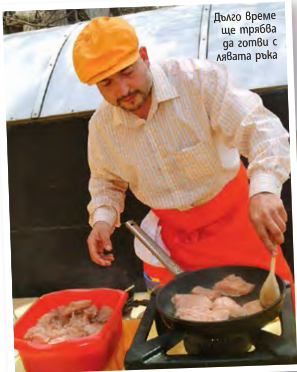
Дълго време ще трябва да готви с лявата ръка

Д раматичният развой за Ути в Dancing Stars със счупената му при тренировка ръка всъщност се оказа не толкова драматичен за самия него.