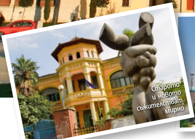
Старото и новото съжителстват мирно