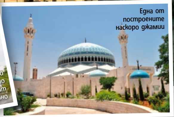
Една от построените наскоро джамии