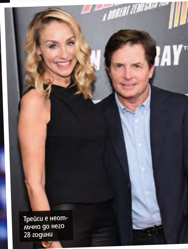
Трейси е неот- лъчно до него 28 години

МАЙКЪЛ ФОКС 25 години се бори с болестта на Паркинсон, съпругата му и Чарли Шийн искат да останат с него до края