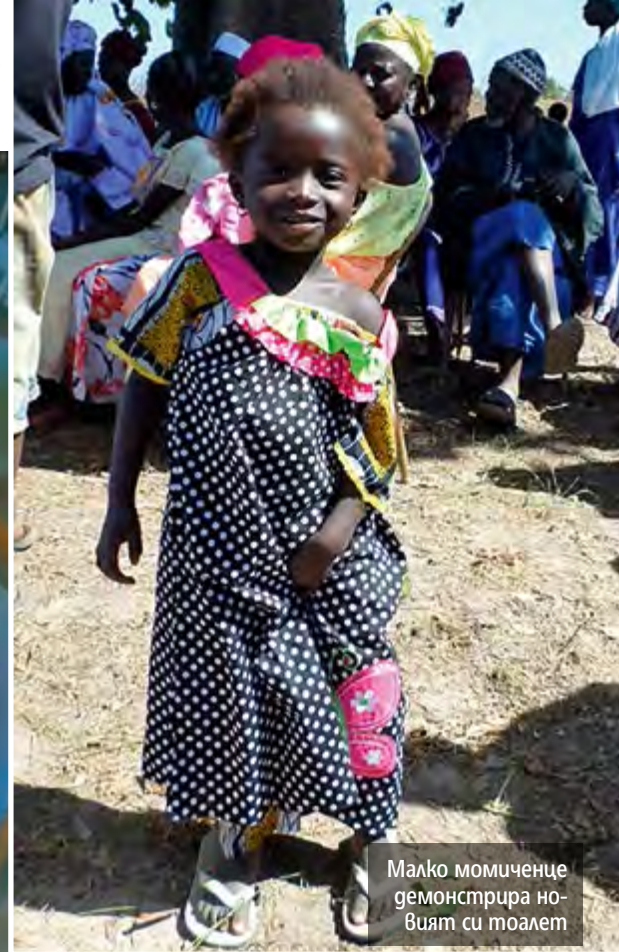
Малко момиченце демонстрира новият си тоалет