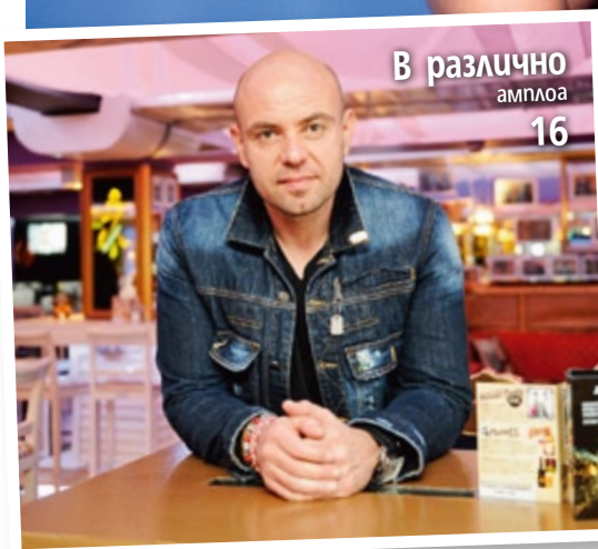
В различно ампло 16