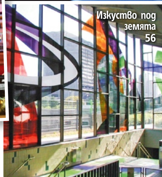
Изкуство пог земята 56