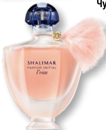
Чувствени ухания 40

Посетете страницата ни във facebook списание „Story“