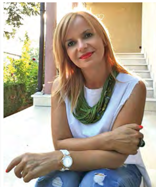
АВТОР: ДОРА ПРАНГАДЖИЙСКА, DORAPRANGADZHIYSKA.COM

Дефицитът на майчина любов е пагубен за детето и аз доста говоря за това. Днес обаче ми се иска да погледна другата страна на майчината любов, онази предозираната, която може да се окаже също толкова пагубна, колкото и отсъстващата. Онази любов, която поставя пред невъзможност детето да функционира само. Онази любов, която не му позволява да пада безброй пъти, докато се научи да ходи. Онази любов, която забранява грешките, а с това и опитите, които придобива. Онази любов, която поставя пред невъзможност детето да си тръгне и да извърви своя път. Онази любов, която не позволява да бъде отрязана невидимата емоционална пъпна връв, с която оставяме детето в собствения си плен. В психотерапията казваме, че единствената любов, чиято крайна цел е раздялата е родителската. Животните го могат! Наскоро прочетох как орлицата прави гнездото си от пръчки, като оставя разстояния между тях, които при раждането на малките запълва с мъх и трева, за да им е меко и топло. Когато малко отраснат, тя сама започва да маха меката постелка, за да могат, падайки от дупките на гнездото, да се научат да летят и да си тръгнат от нея. Да, животинският свят е свършен, за разлика от нас – цивилизованите човеци, които, водени от страхове и