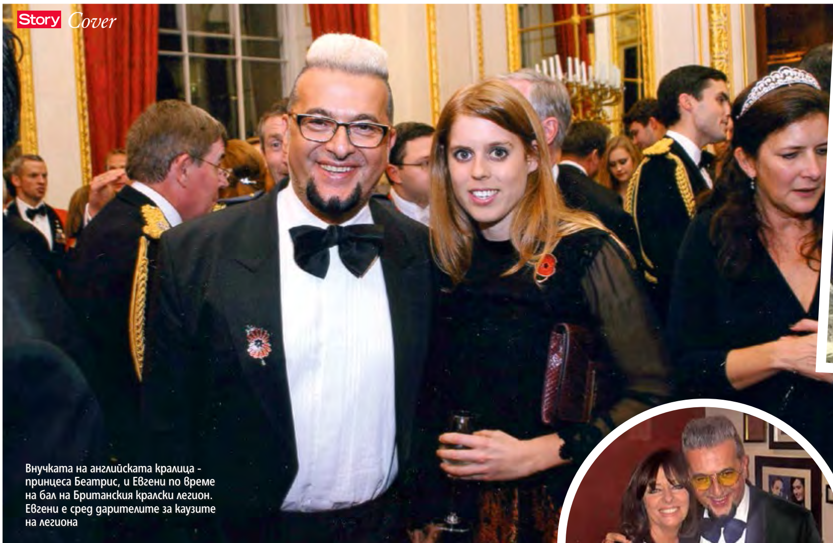
Внучката на английската кралица - принцеса Беатрис, и Евгени по време на бал на Британския кралски легион. Евгени е сред дарителите за каузите на легиона