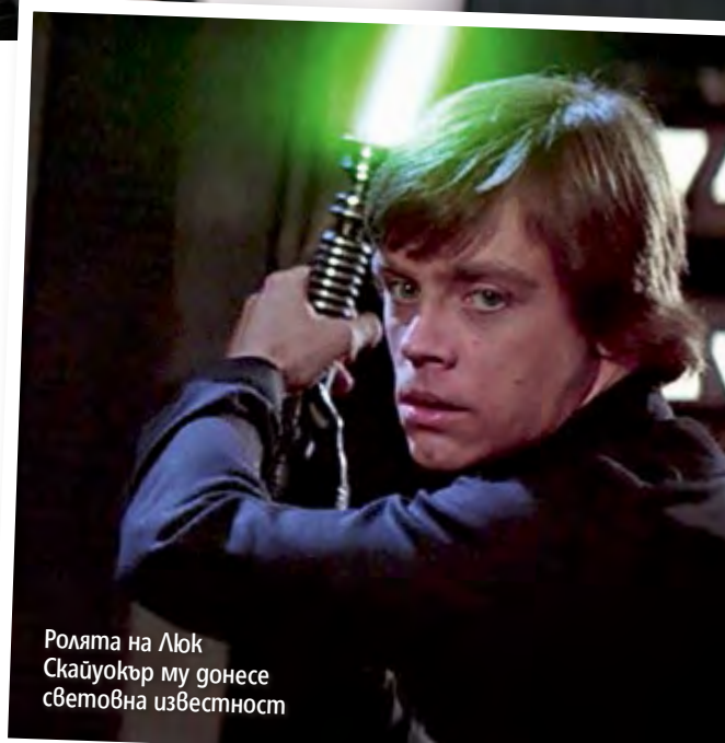
Ролята на Люк Скайуокър му донесе световна известност

на почитателите техният герой се завърна в новата серия на „Междузвездни войни – Силата се пробужда“, макар превалял 60-те. Но това му коства не само физически усилия със задължителните тренировки, за да влезе във форма, но и строги диети, на които се подлага, за да свали 23 кг. Участието в новия епизод носи на Хамил болезнените спомени за една катастрофа през 1977 г. по време на снимките, в коя-