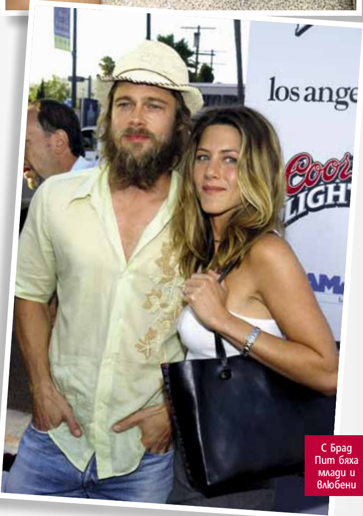
С Брад Пит бяха млади и влюбени