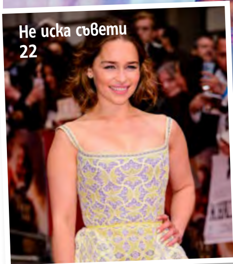
Не иска съвети 22