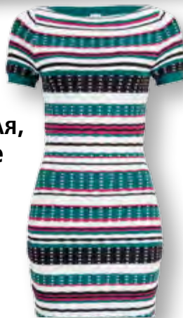
Р като рокля, Р като райе 62

Списанието може да закупите и в електронен Вариант от helikon.bg, biblio.bg, ciela.com