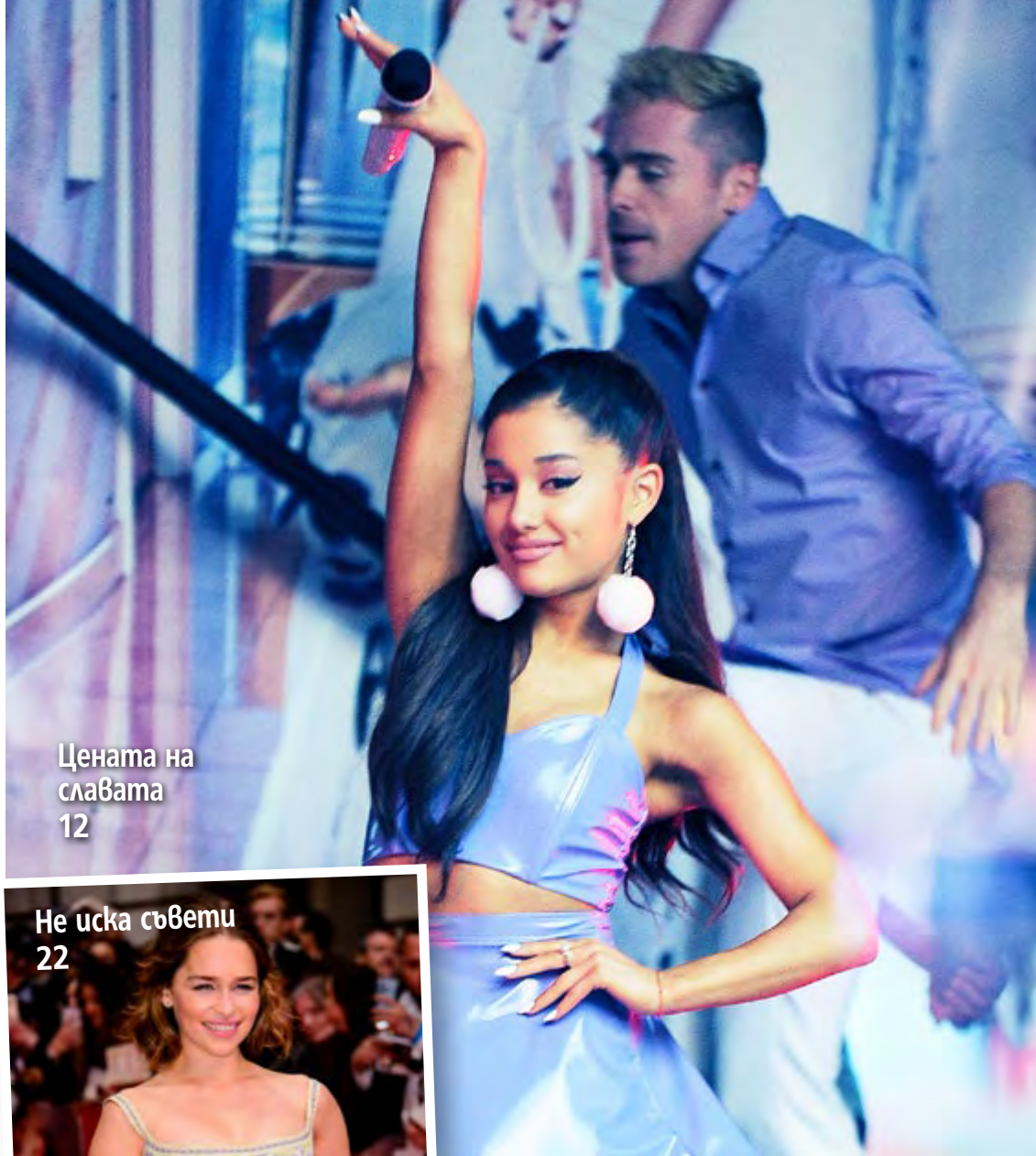
Цена на славата 12