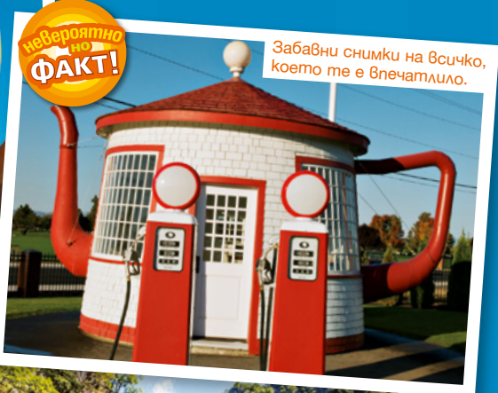
Забавни снимки на всичко, което те е впечатлило.