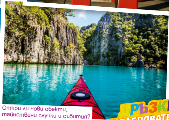
Откри ли нови обекти, тайнствени случки и събития?

Всеки град има места, които са забележителни със своята архитектура и настроение. Покажи ни твоите снимки от сърцето на София – такава, каквато си я видял, докато си се разхождал, докато си бил на екскурзия или просто си разглеждал непознати кътчета.