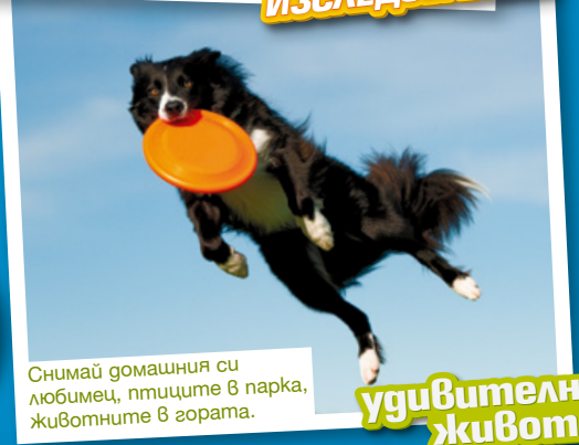
Снимай домашния си любимец, птиците в парка, животните в гората.