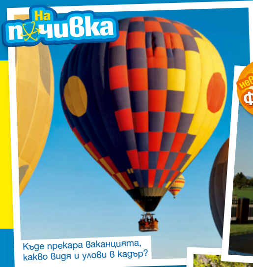
Къде прекара ваканцията, какво видя и улови в кадър?