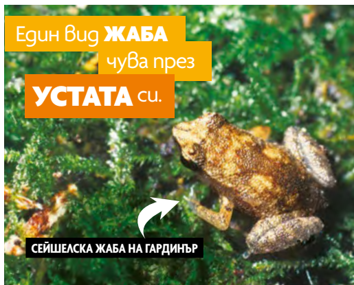
СЕЙШЕЛСКА ЖАБА НА ГАРДИНЪР

В един бразилски ЗАТВОР използвали КРЯКАЦИ ГЪСКИ като алармена система.