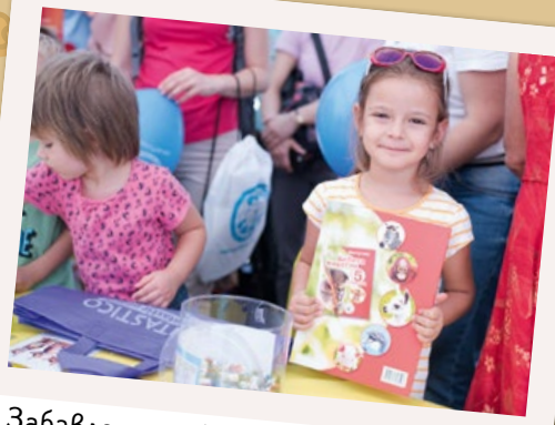
Забавления с животни и фантастични подаръци имаше за всички на шатрата на Фантастико

Благодарим на всички партньори за подкрепата и доверието!