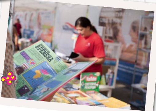
Книгомания отново имаха отговори на всички въпроси