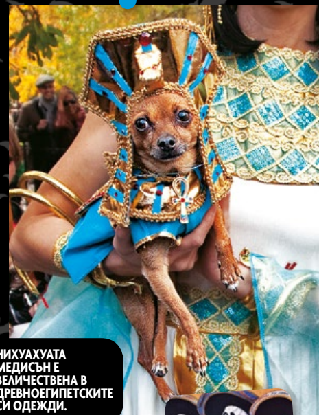
ЧИХУАХУАТА МЕДИСЪН Е ВЕЛИЧЕСТВЕНА В ДРЕВНОЕГИПЕТСКИТЕ СИ ОДЕЖДИ.

Nearly 17 percent of Americans dressed up their pets last year.