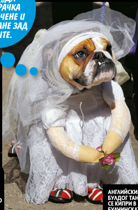
АНГЛИЙСКИЯТ БУЛДОГ ТАНК СЕ КИПРИ В БУЛЧИНСКАТА СИ РОКЛЯ.