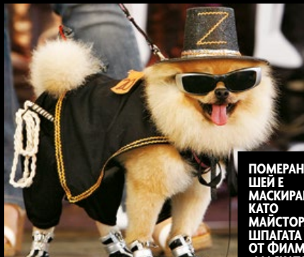
ПОМЕРАНЪТ ШЕЙ Е МАСКИРАН КАТО МАЙСТОРА НА ШПАГАТА ЗОРО ОТ ФИЛМА „МАСКАТА НА ЗОРО“.