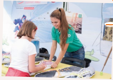
Deichman ни научи как да направим перфектната фълонга