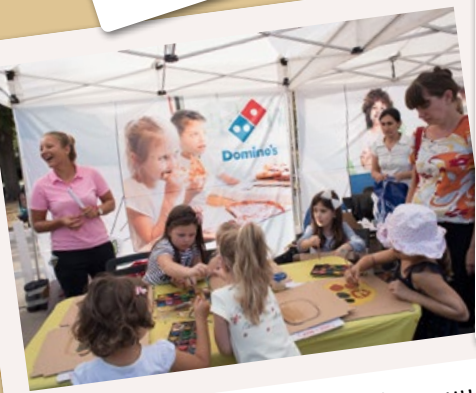
Dominos ни научи как да правим пица... с боички