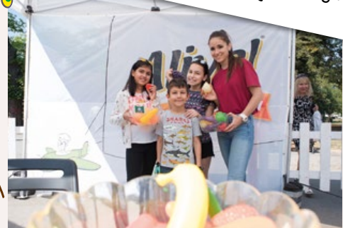
Ползата от витамините и къде се срещат в природата научихме от мултивитамини Alive