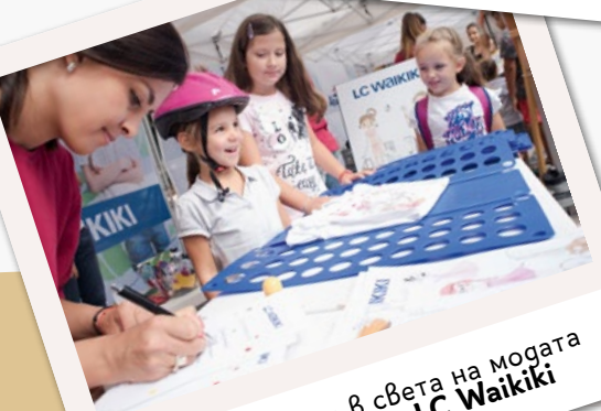
Разходихме се в света на модата благодарение на LC Waikiki