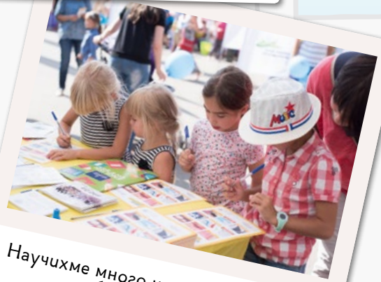
Научихме много интересни неща за зъбките с EO Dent