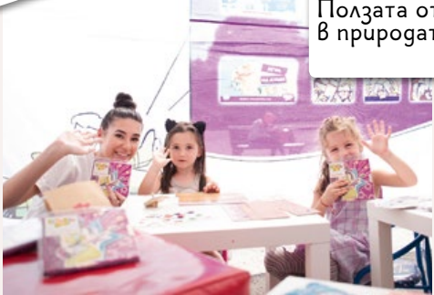
Играхме всевъзможни интересни образователни игри с Thinkle Stars