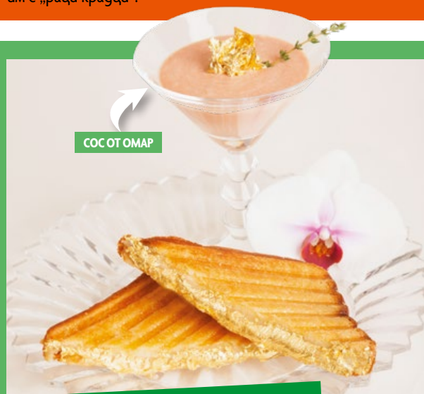
СОС ОТ ОМАР