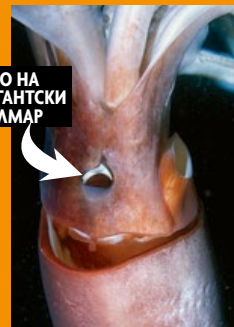
ОКО НА ГИГАНТСКИ КАЛМАР

Ако имаш око колкото футболна топка, сигурно ще спечелиш титлата за „Най-голямо око на планетата“ – а тя определено е гарантирана на гигантския калмар . Огромните очи помагат на дълбоководното главоного да се оглежда за най-големия си враг – кашалота.