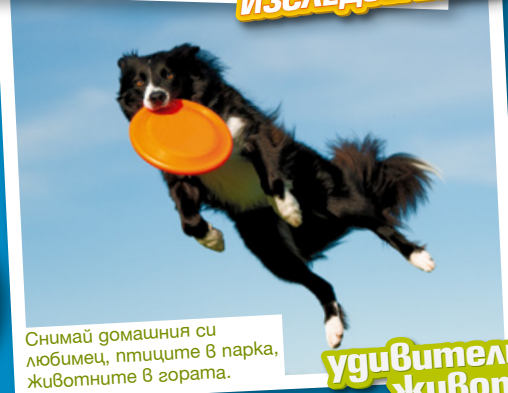
Снимай домашния си любимец, птиците в парка, животните в гората.