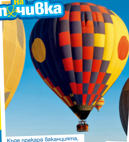
Къде прекара ваканцията, какво видя и улови в кадър?