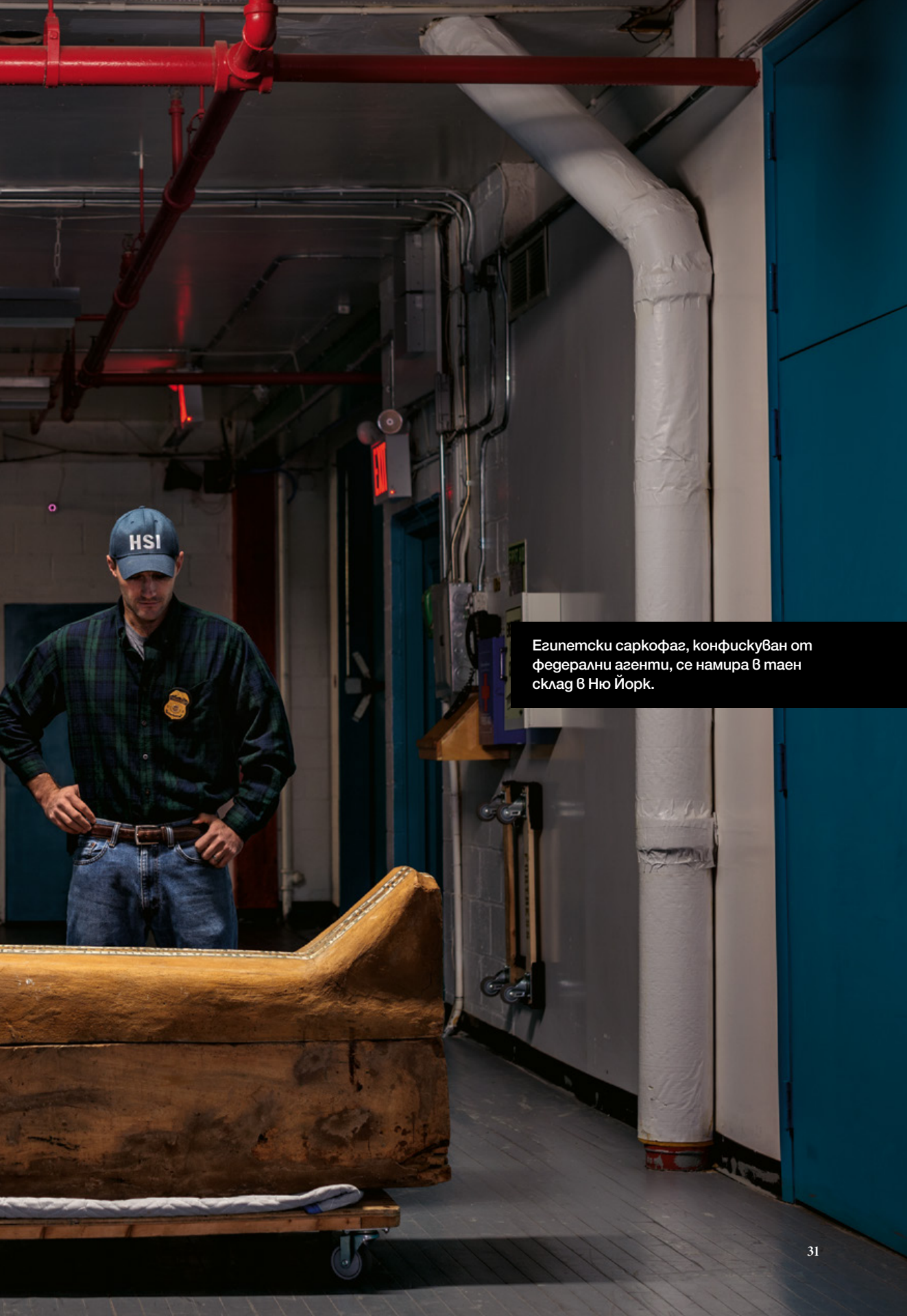
Египетски саркофаг, конфискуван от федерални агенти, се намира в таен склад в Ню Йорк.