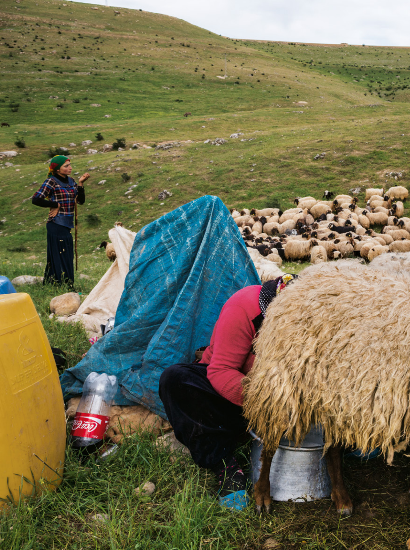
Пастирите в Югоизточна Турция подкарват овците си из пасища, над които са се носели виковете на кюрдски, арменски, арабски и турски овчари. По време на Първата световна война Османската империя