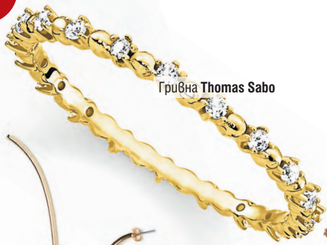
Грибна Thomas Sabo