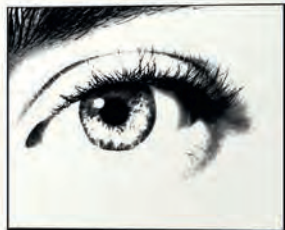
Аромат Women на Calvin Klein