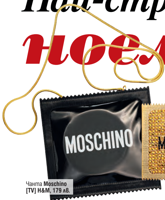
Чанта Moschino [TV] H&M, 179 лв.