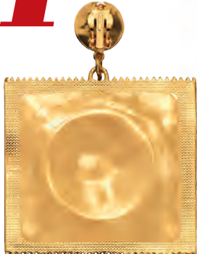
Общи Moschino [TV] H&M, 89,99 лв.