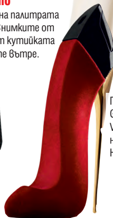
Парфюм Good Girl Velvet Fatale на Carolina Herrera