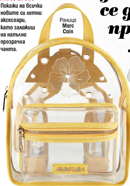
Раница Marc Cain

Покажи на всички новите си летни аксесоари, като заложиш на напълно прозрачна чанта.