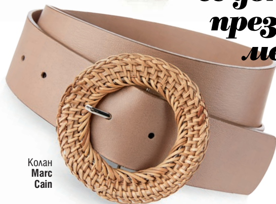
Колан Marc Cain

Подчертай силуета си елегантно. Защо не с този колан.