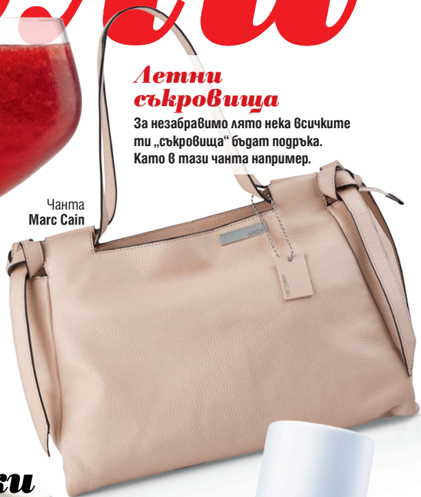
Чанта Marc Cain

За две чаши ти трябваат 80 мл ром, 60 мл лимонов сок, 100 г ягоди, 1 ч.л. захар. Смеси всичко това в блендера, а накрая добави натрошен лед.