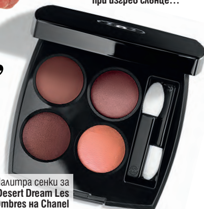
Палитра сенки за очи Desert Dream Les 4 Ombres на Chanel

Всички хубави неща, до които да се докоснеш през този месец