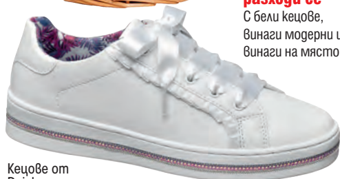
Кецове от Deichmann

Всички хубави неща, които да направиш този месец