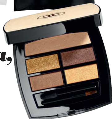
Палитра сенки за очи Les Beiges Healthy Glow Natural на Chanel, нюанс Deep