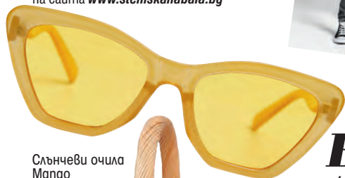
Слънчеви очила Mango