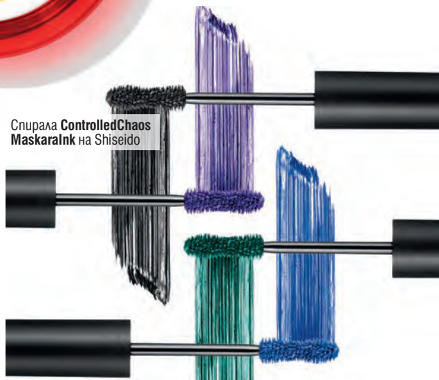
Спирала ControlledChaos MaskaraInk на Shiseido