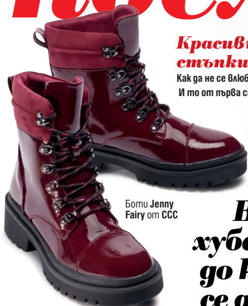
Боту Jenny Fairy от CCC

Как да не се влюбиш. И то от първа стъпка!