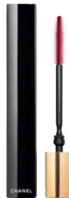
Спирала Chanel Noir Allure All-In-One Mascara

Фон дълбоко тен Yves Saint Laurent – All Hours . Коректор KVD Beauty – Good Apple Concealer . Руж Rare Beauty – Stay Vulnerable . Вежди гел за вежди Anastasia Beverly Hills – Brow Freeze , молив за вежди NYX – LIFT & SNATCH BROW TINT PEN . Контур: Палитра Make up Forever – ULTRA HD FOUNDATION PALETTE . Молив за очи Gucci – Kohl Stylo Contour . Устни MAC Cosmetics . Пигменти Beauty Bay