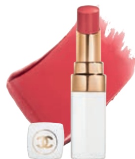
Балсам за устни Chanel Rouge Coco Baume , колекция Les Beiges Winter , цвят 940 Coccoon