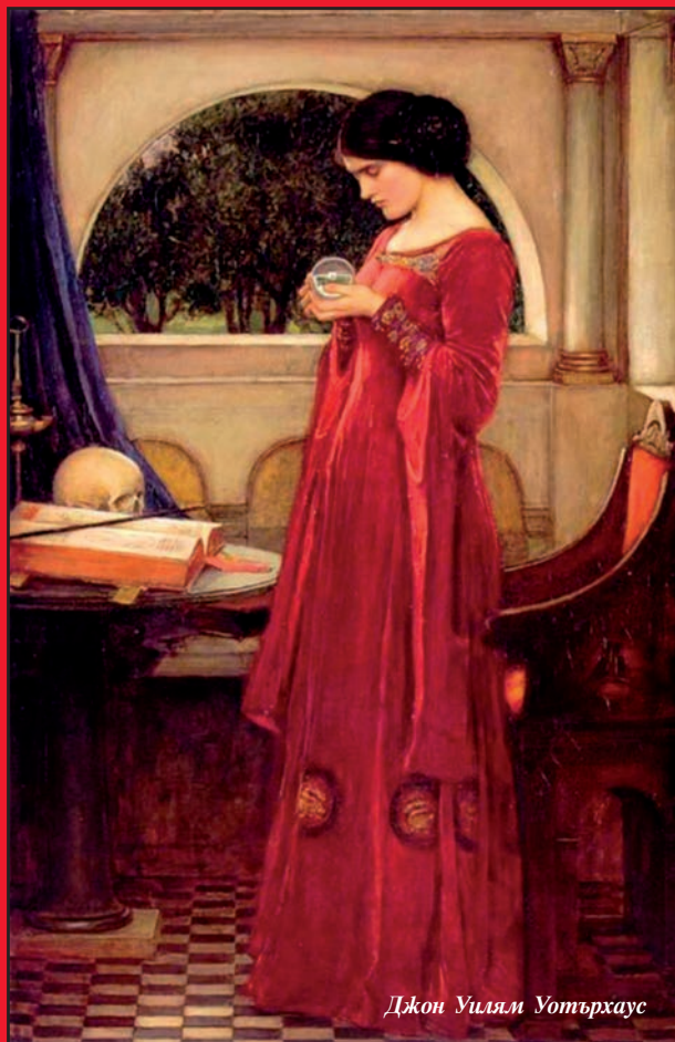
Джон Уилям Уотърхаус