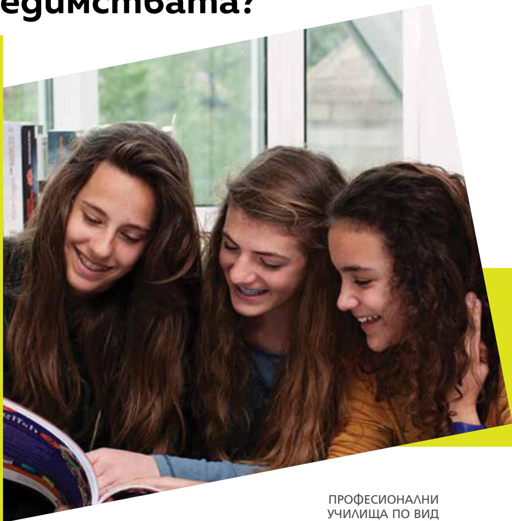
ОБЩООБРАЗОВАТЕЛНИ УЧИЛИЩА ПО ВИД

В последните години все повече се наблюдава тенденцията за нарастването на предпочитанията към частните средни училища. Според Националния статистически институт под 2% са учениците, записани в частни образователни институции за учебната година 2016/2017, в това число се включват не само гимназии, а и основни училища до 7-ми клас. Броят на частните училища в страната е 121 за изминалата учебна година, което е около 5% в сравнение с държавните и общинските. От 2011 до 2016 г. броят им е нараснал с около 1%.