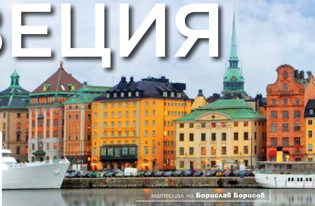
материал на Борислав Борисов

Населението на Швеция възлиза на около 10 милиона души. То е неравномерно разпределено по територията на страната - най-гъсто населени са южните райони, особено крайбрежията. Северните и южните части на Швеция значително се различават по отношение на стил и начин на живот. Докато на юг модерната цивилизация присъства във всеки елемент на съвременния живот, то на север хората все още разчитат главно на традиционни отрасли като отглеждането на елени. Най-големите градове са съответно Стокхолм с население на градската агломерация над 2 000 000, и Гьотеборг, чиято агломерация е дом на около 1 милион души. Тъй като Швеция е атрактивно място за работа, тук живеят и голям брой емигранти - около 15% от общото население на страната.