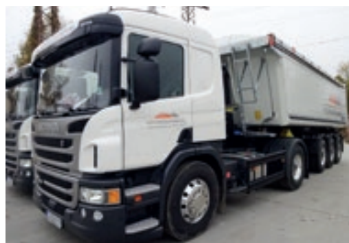
Трите Scania P450 са първите от шведската марка в парка на Хидроминерал

Хидроминерал ООД стартира своята дейност през март 2009 г. От създаването си фирмата се занимава с добив и производство на инертни материали за строителството. Чрез собствения си транспортен парк, в който има 23 товарни автомобили – влекачи с гондоли и самосвали, компанията осигурява на партньорите си надеждност в срока на доставките.