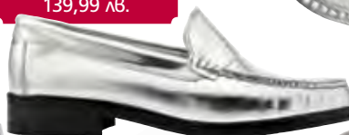
Обувки Mango 139,99 лв.