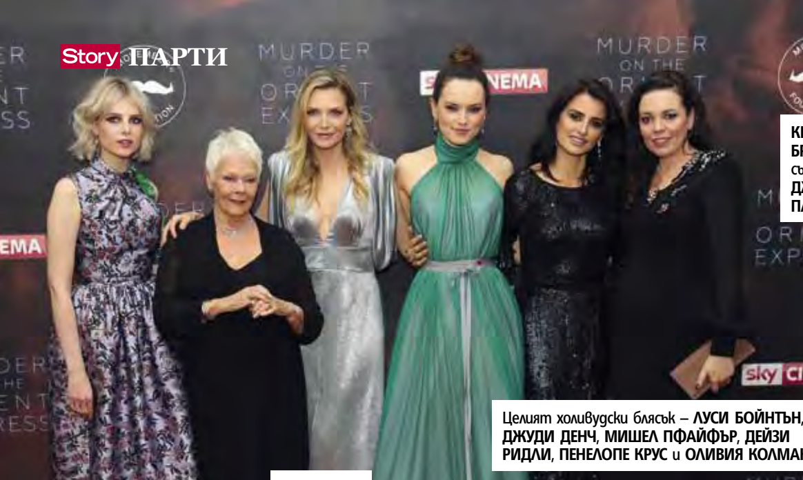
Целият холивудски блясък – ЛУСИ БОЙНТЪН, ДЖУДИ ДЕНЧ, МИШЕЛ ПФАЙФЪР, ДЕЙЗИ РИДЛИ, ПЕНЕЛОПЕ КРУС и ОЛИВИЯ КОЛМАН