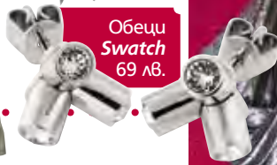
Обеци Swatch 69 лв.