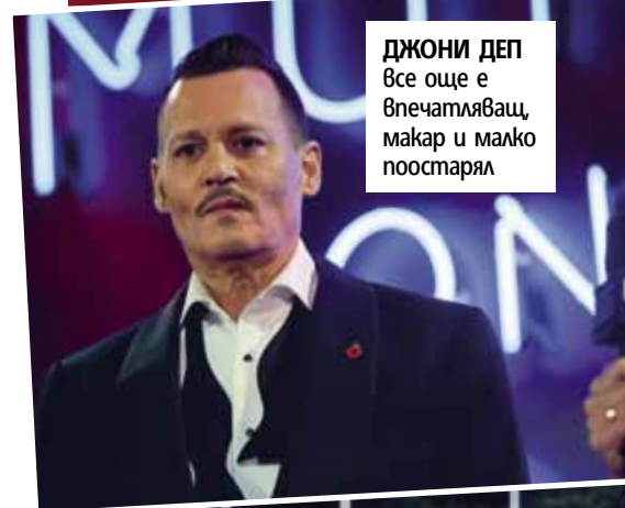
ДЖОНИ ДЕП все още е впечатляващ, макар и малко поостарял

Л егендарната зала „Роял Албърт Хол“ събра куп звезди за световната премиера на дългоочакваната екранизация по класиката на Агата Кристи „Убийство в Ориент Експрес“. Червеният килим едва ли скоро е усещал стъпките на толкова знаменити холивудски актриси и актьори. Мишел Пфайфър, Джонни Деп, Дейзи Ридли, Пенелопе Крус обсипаха почитателите с холивудски блясък и усмивки. Заедно с тях на тур за овации преминаха колегите им Оливия Колман, Джуди Денч, Уилям Дефо, Луси Бойнтън и режисьорът на лентата Кенет Брана. Публикуван през 1934 година, романът на Агата Кристи „Убийство в Ориент Експрес“ е определян за една от най-гениалните истории, създавани някога. Повече от 80 години след издаването му, романът продължава да е любим и на нови поколения читатели. Представянето на известната мистерия от Кенет Брана с толкова звезден актьорски ансамбъл и спираща дъха визия ни отвежда на най-напрегнатото пътуване с влак. ■