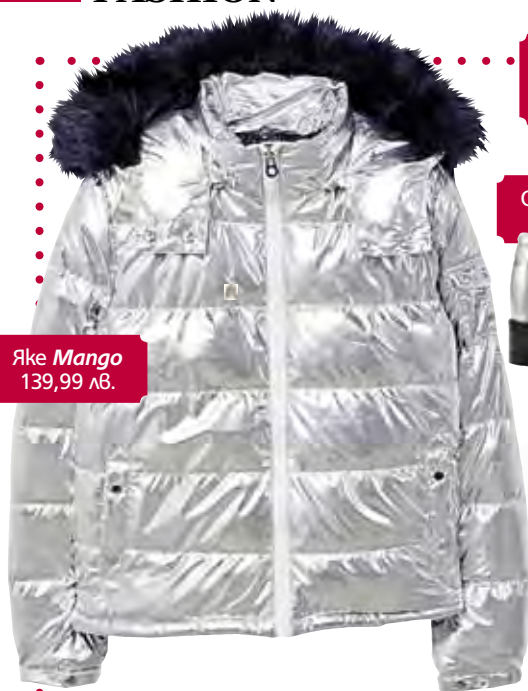
Яке Mango 139,99 лв.