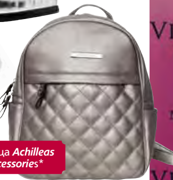
Раница Achilleas Accessories*