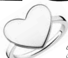
Пръстен Thomas Sabo*