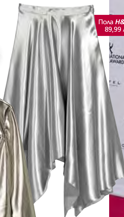
Пола H&M 89,99 лв.