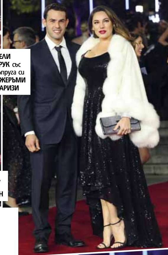
КЕЛИ БРУК със съпруга си ДЖЕРЪМИ ПАРИЗИ