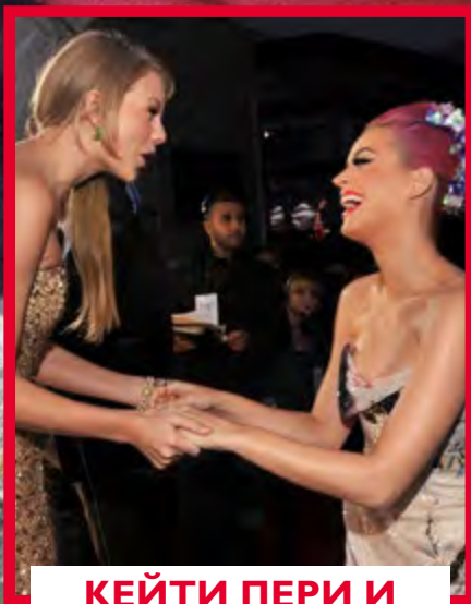
КЕЙТИ ПЕРИ И ТЕЙЛЪР СУИФТ

КОШМАРНИЯТ ЖИВОТ НА НАЙ-ОБИЧАНАТА ПРИНЦЕСА