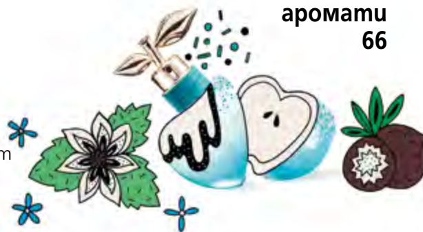
Сладки аромати 66

Списанието може да закупите и в електронен Вариант от helikon.bg, biblio.bg, ciela.com